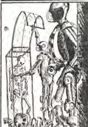
cuyos esqueletos estaban en su mayoría completos, razón por la que nos serían de cierta utilidad para nuestra investigación.