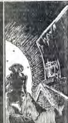
Pero lo principal sus documentos, según brillando por su ausencia.